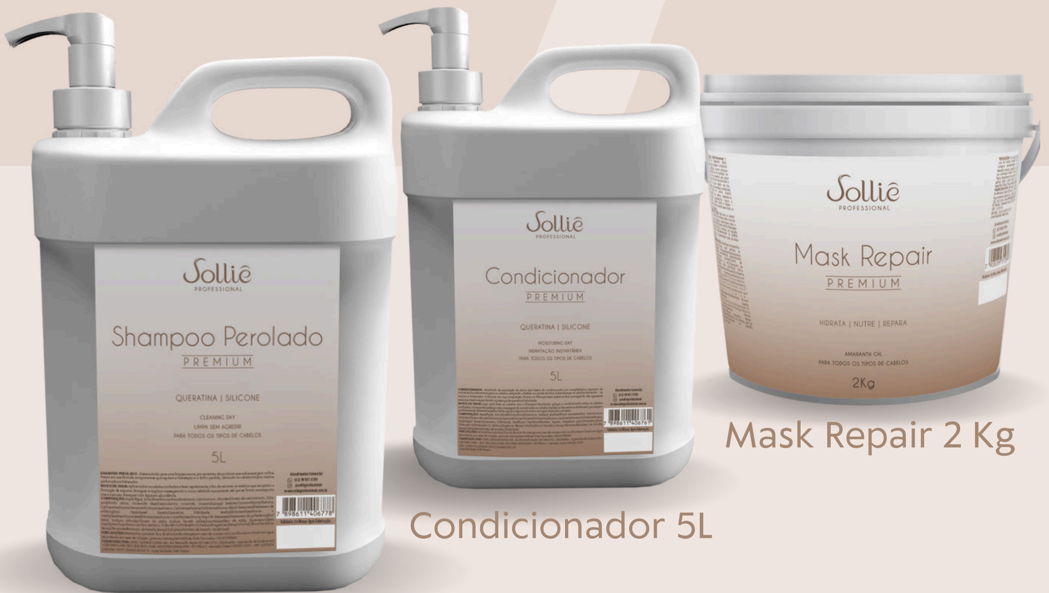
Shampoo Perolado 5 L